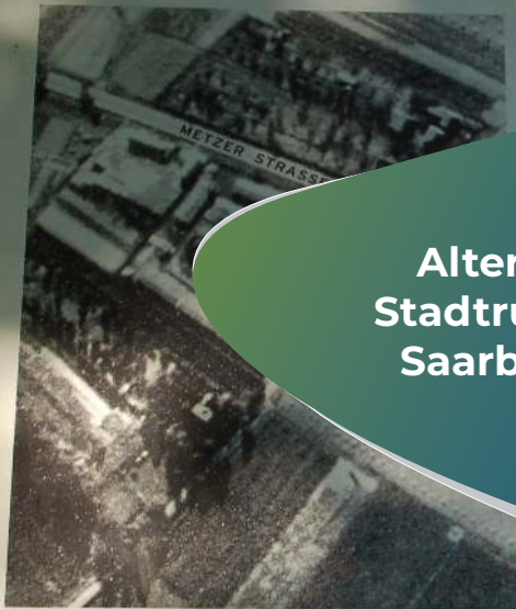
Luftbild, August 1944 - Prise de vue aérienne, août 1944